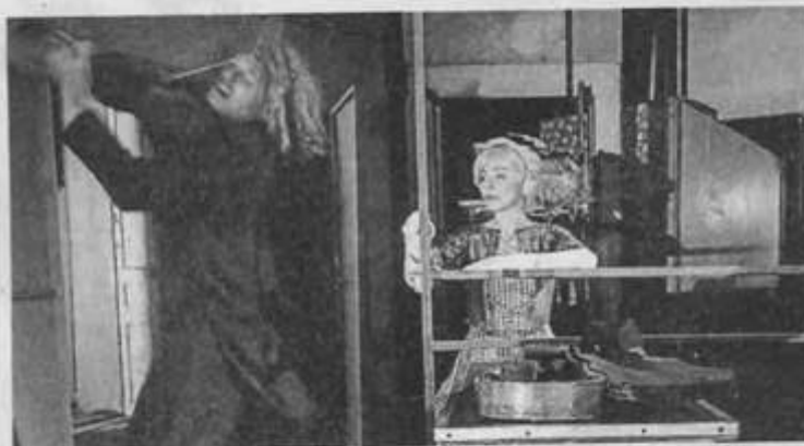
Une scène de « Soubresaut ».

Une posture difficile, nécessitant du muscle et de la concentration. Tout en enchaînant des extraits de textes littéraires, français, allemands, anglais.