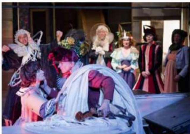
SOUBRESAUT, théâtre du 14 au 17 mars au Centre dramatique national de Besançon, en novembre 2017 au Théâtre national de Strasbourg www.cdn-besancon.fr