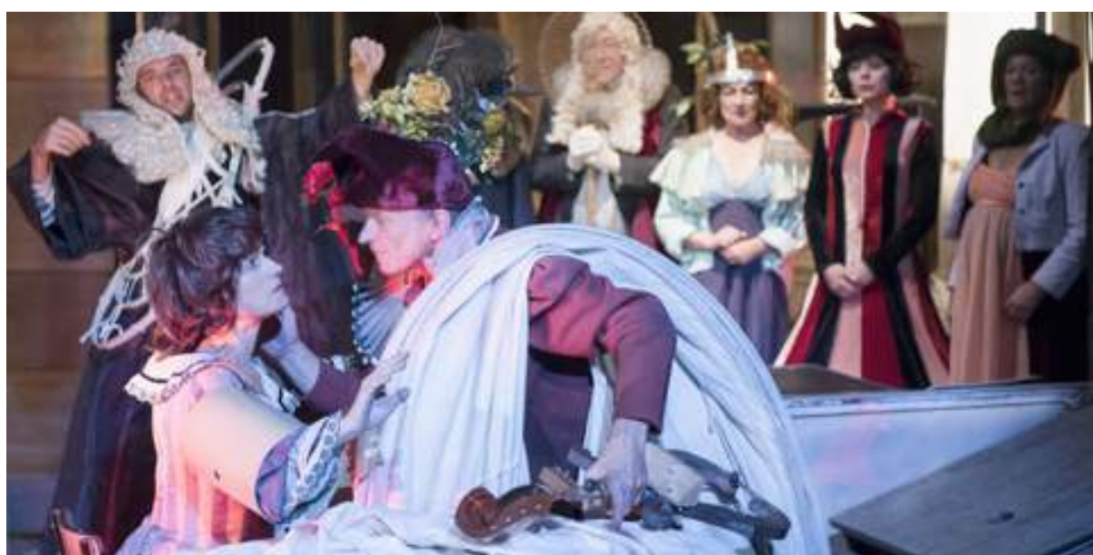
Soubresaut illustration

D'une grâce aérienne et d'une étonnante plasticité, ce spectacle très enjoué ravit aussi par ses délicieux moments de cocasserie. Au fil d'un enchevêtrement de séquences savamment agencées où les perspectives se recomposent indéfiniment comme mues par une logique de rêve, le metteur en scène anime avec les comédiens du Théâtre du Radeau un formidable jeu de miroirs.