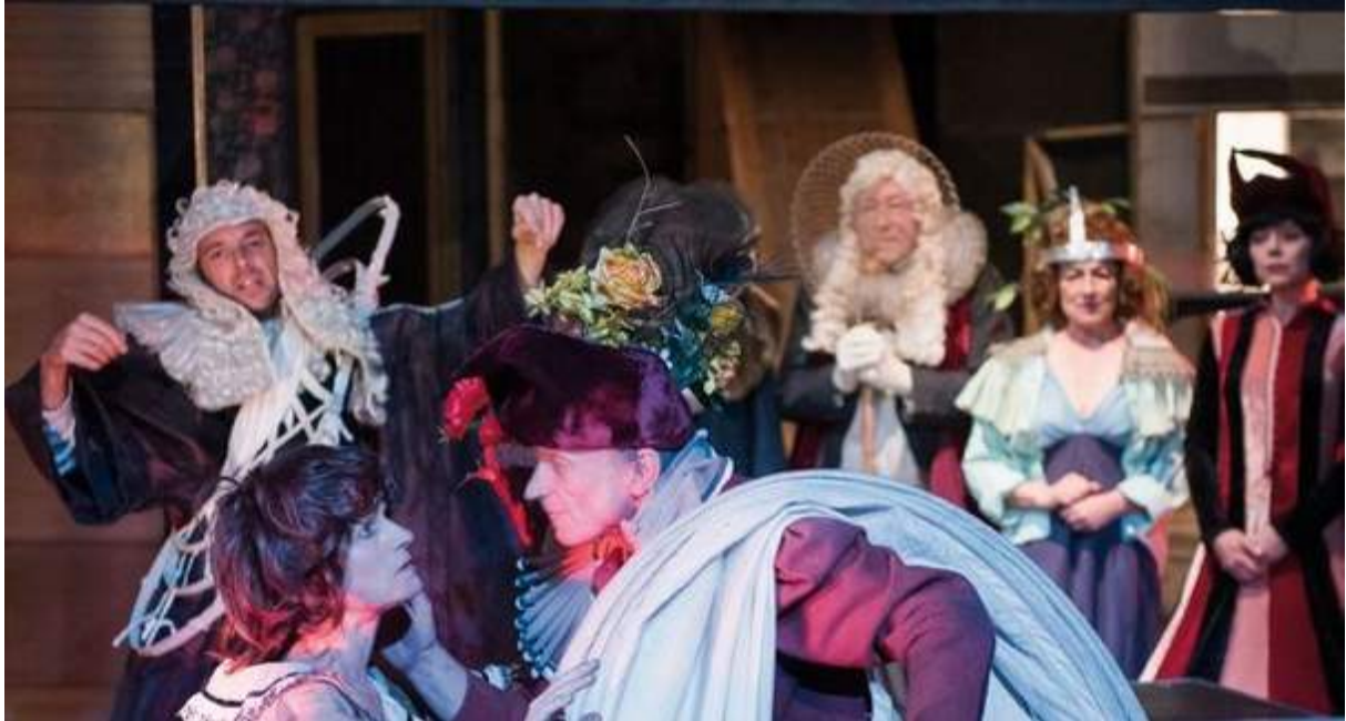
«Soubresaut» de François Tanguy et le théâtre du Radeau.