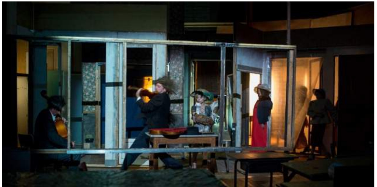
Soubresaut-Théâtre du Radeau

Création le 2 novembre 2016 au Théâtre National de Bretagne à Rennes - Festival Mettre en scène